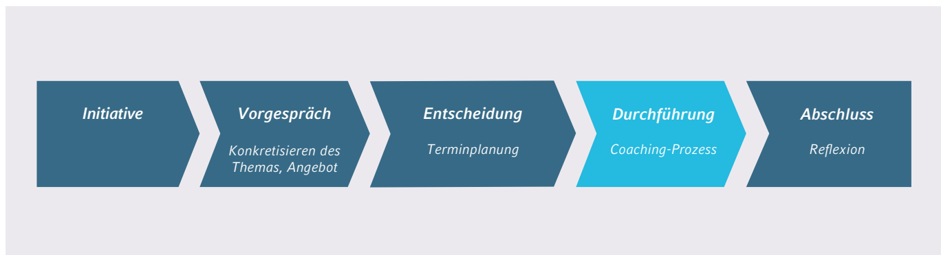
Ablauf des Coaching-Prozesses bei I.Q.